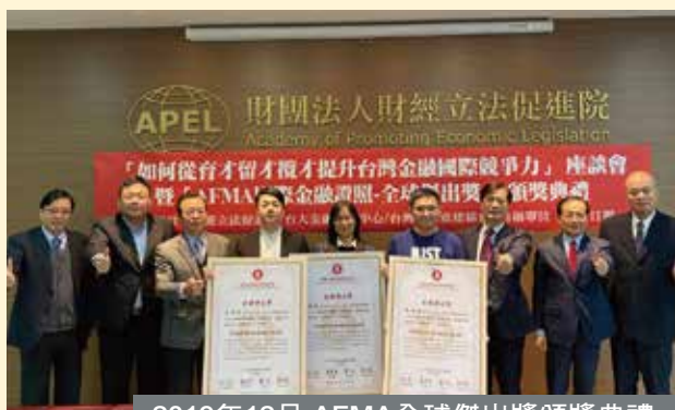
2019年12月 AFMA全球傑出獎頒獎典禮