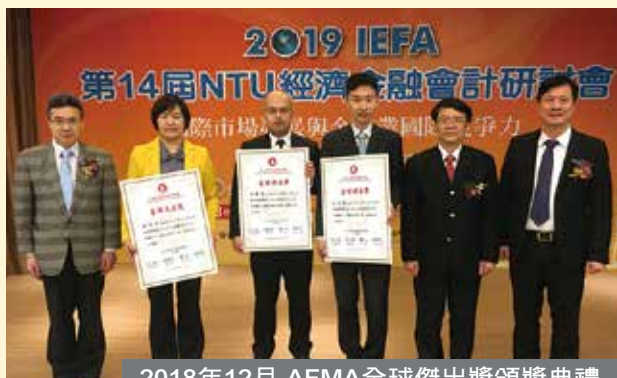
2018年12月 AFMA全球傑出獎頒獎典禮