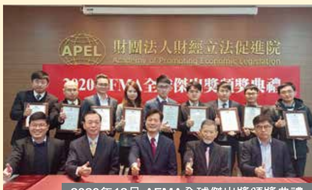
2020年12月 AFMA全球傑出獎頒獎典禮